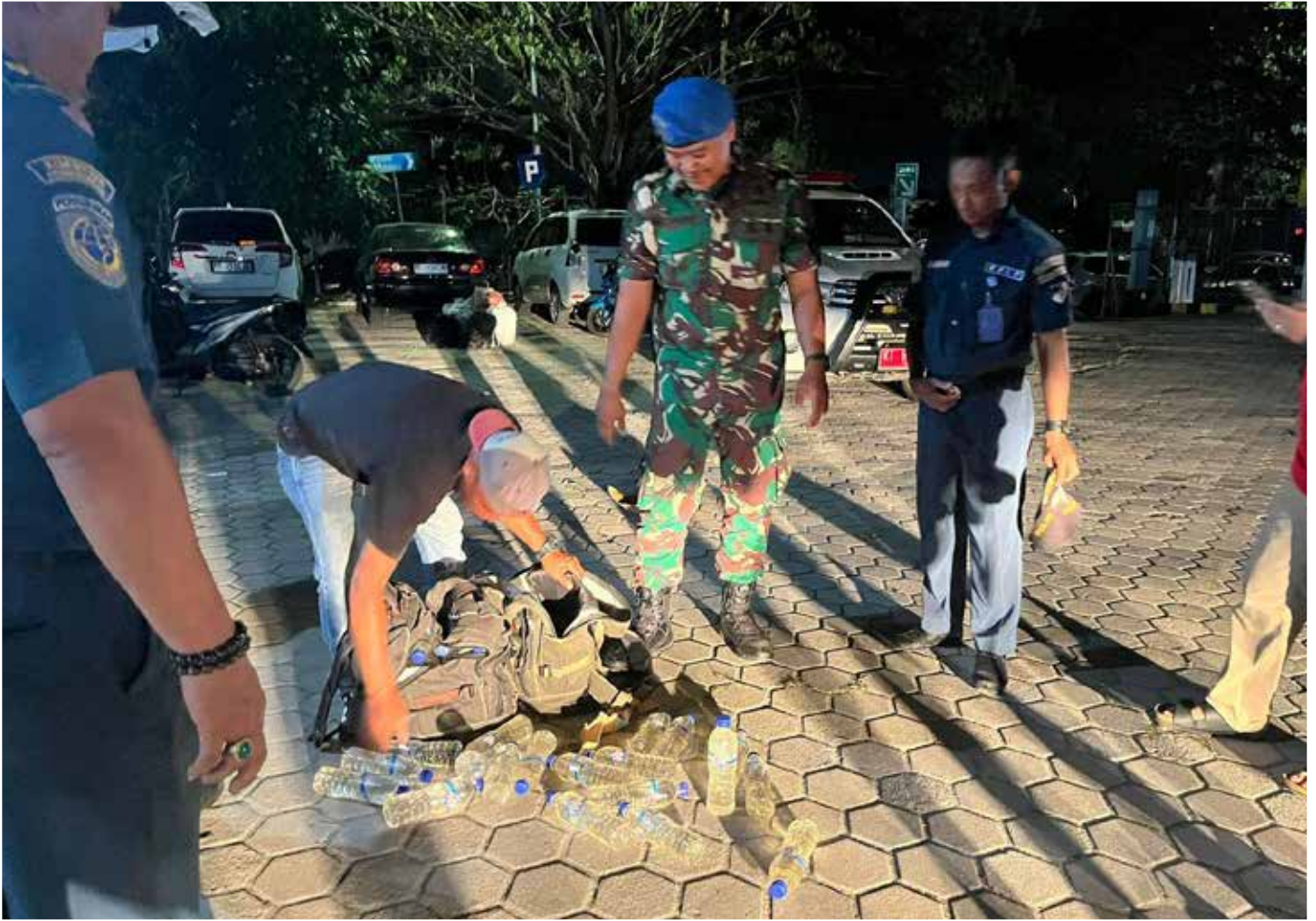
Pengamanan Tas Berisi miras di Pelabuhan Loktuan.