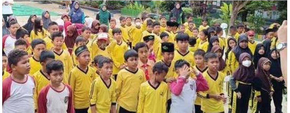
Pelajar SD di wilayah IKN saat mengikuti FEF yang digagas Kedeputian Sosbudpemas Otorita IKN beberapa waktu lalu.

Pada sektor pendidikan di IKN, pengelolaannya tidak akan di bawah dinas seperti biasanya, melainkan langsung ditangani oleh pihak terkait. Ini bertujuan untuk mempercepat proses birokrasi dan penanganan yang sebelumnya seringkali memakan waktu lama. Dalam hal tenaga pendidikan atau guru, prioritasnya adalah untuk memiliki tenaga pendidik yang