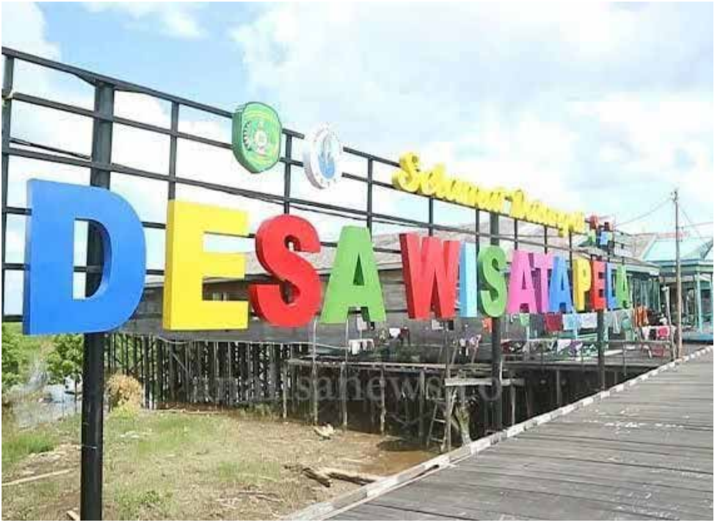
Panorama Desa Wisata Pela, Kecamatan Kota Bangun. (Istimewa)