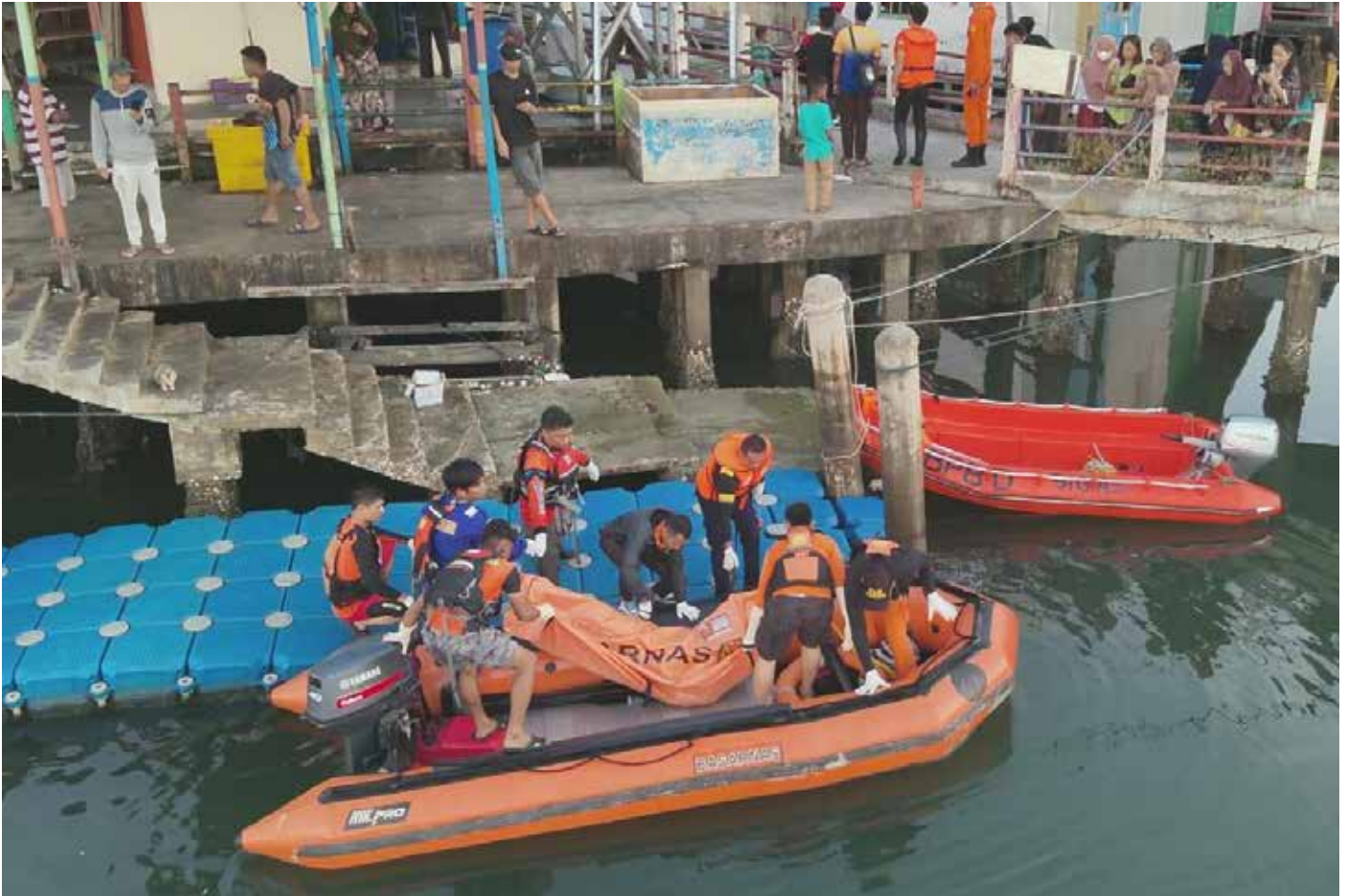
Jasad MA saat dievakuasi ke darat oleh Tim SAR gabungan pada Kamis (18/4).