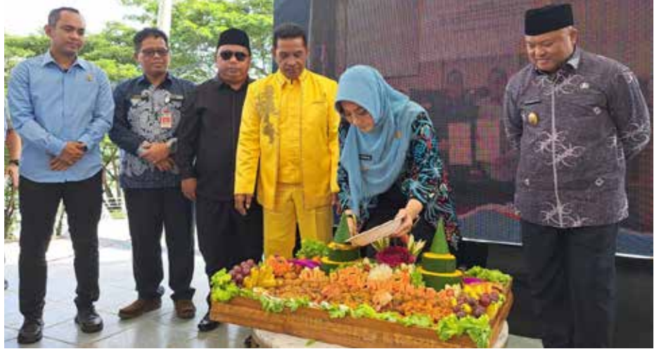
Suasana perayaan Ulang Tahun ke-41 PDAM Batiwakkal, di Taman Bukit Maritam, Jalan Pulau Sambit, Tanjung Redeb, Kamis (18/4/2024).

“Pencapaian ini merupakan hasil kerja keras dan dedikasi seluruh jajaran Perumdam Batiwakkal Berau