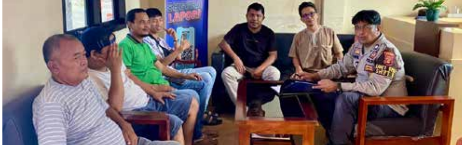
Anggota ATB saat mengajukan gugatan hukum ke Polres Bontang.

"Semua itu sudah ditentukan, untuk menjaga persaingan bisnis tidak boleh lebih mahal ataupun lebih murah," katanya.