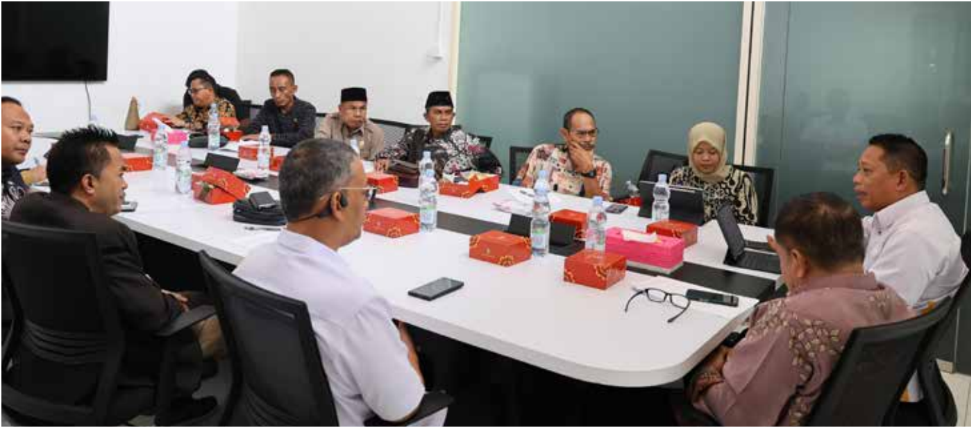
Rapat koordinasi yang diadakan oleh Otorita IKN bersama DPRD Kabupaten Kutai Kartanegara (Kukar) di Kantor Otorita IKN, Balikpapan, pada hari Senin (22/04/2024).