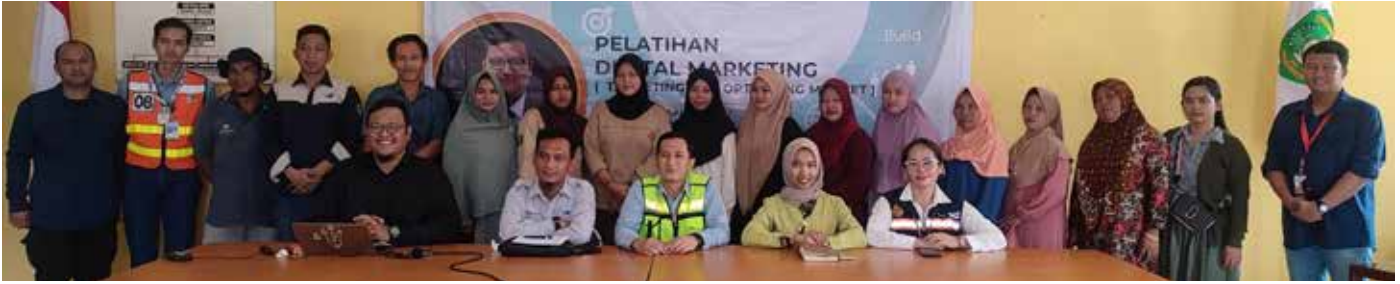
Kegiatan pelatihan digital marketing PAMA dan IMM.